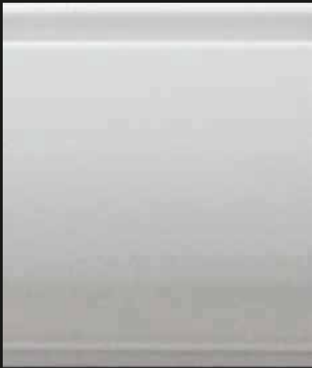
SEGU R EC-60