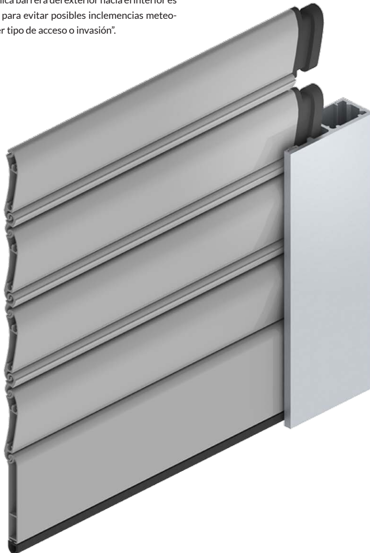
Detalle de Extreme.

La guía y tapones especiales en los extremos de cada lama de Extreme (sistema compatible con modelos de lama Segur EC60 y VS-150 Block 60) impiden que, en conjunto, esta se salga, aportando un extra de resistencia y seguridad al conjunto de la ventana o puerta, pudiendo deformarse ante una extraordinaria presión, pero sin llegar a romperse. "La resistencia del sistema Extreme y los grandes resultados que nos ha aportado, también en países con climas extremos, nos ha hecho empeñarnos en seguir trabajando por ofrecer valores de seguridad inmejorables. Ahora soporta la presión de vientos huracanados de escalas superiores a las que existen", explica el director técnico de Persax.●